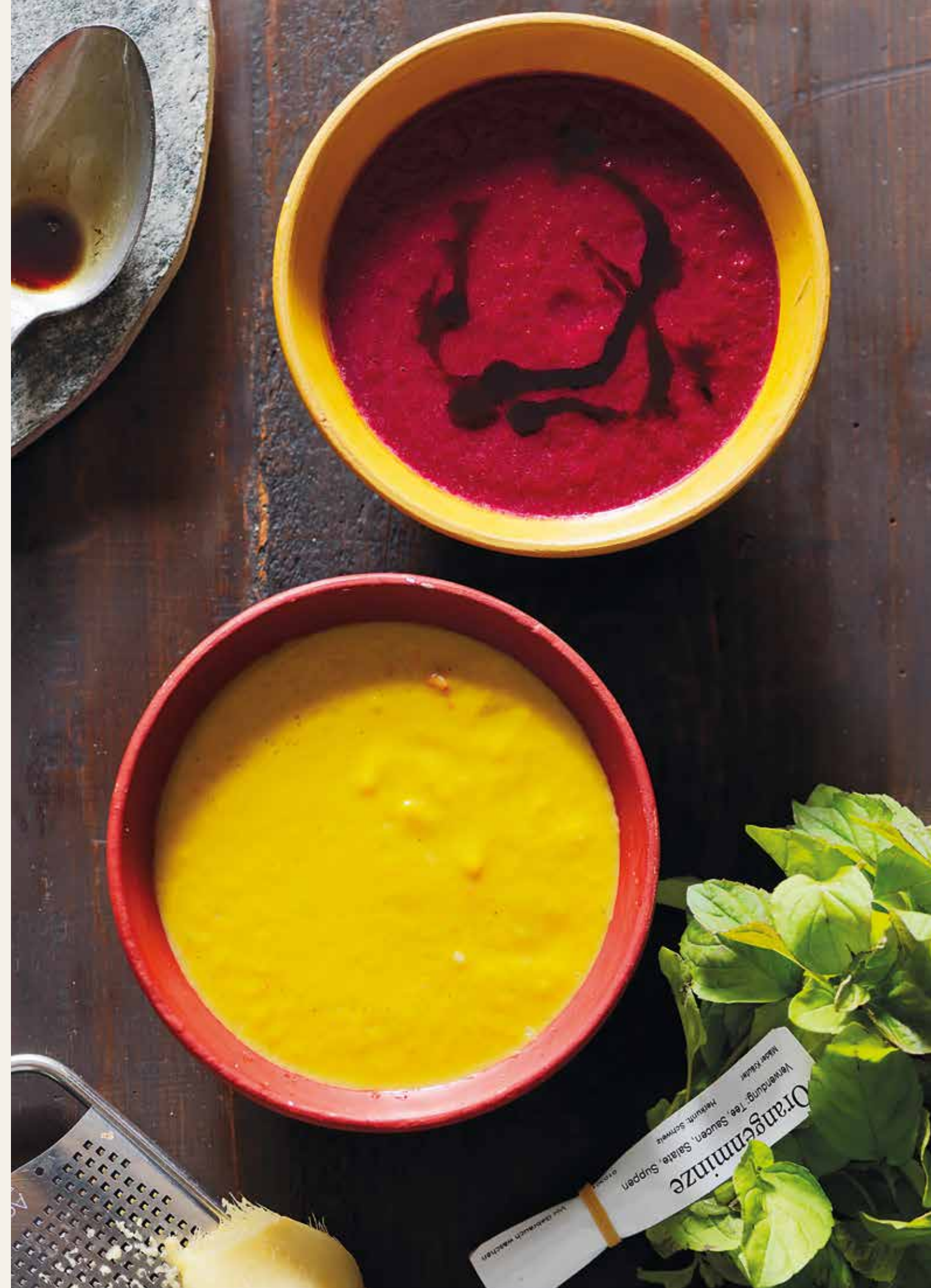
Abbildung unten: Kürbis-Cremesuppe, Rezept Seite 82